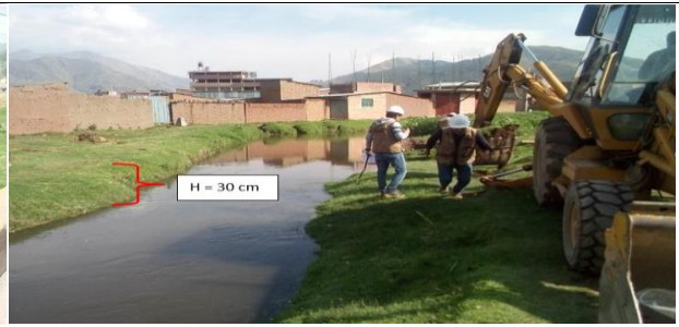
FOTO 01: Se Aprecia el curso del agua del río TINTAYA, riberas de taalud natural y cauce estrangulado