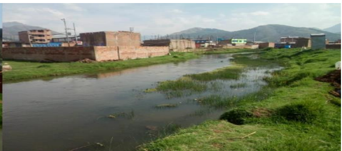
FOTO 02 y 03: Se Aprecia el curso del agua en época de avenidas con cauce colmatada, localizado en el sector comunidad Chumo del distrito de Sicuani.